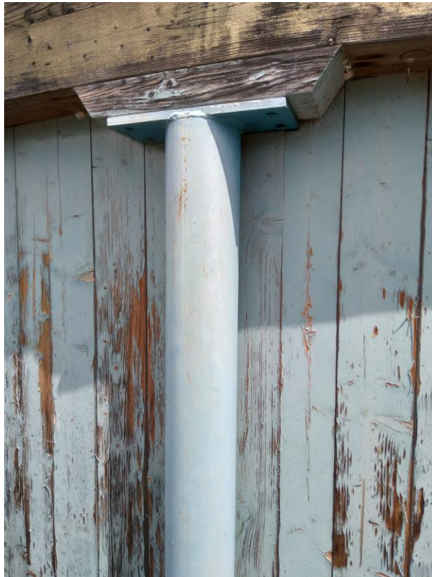
Pilastri in ferro