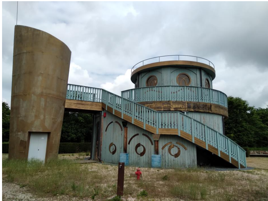
Giardini della Reggia . Fantacasino