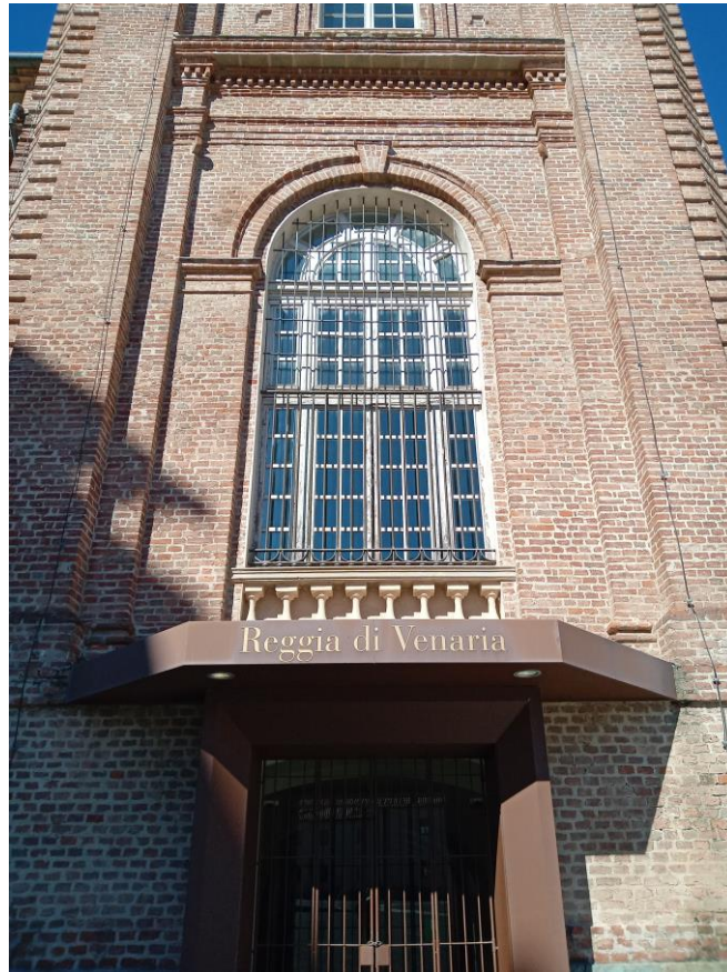
Reggia- Belvedere Alfieriano: serramento del piano nobile lato est