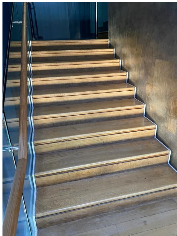
Sale delle Arti: pavimento in legno della scala