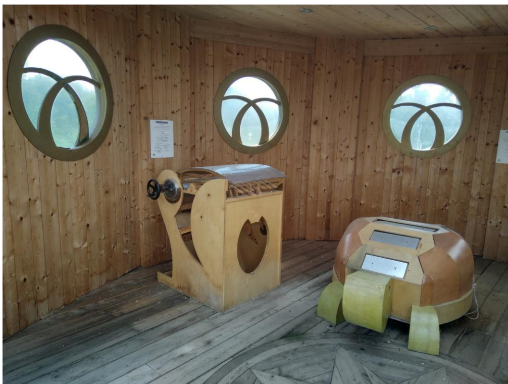
Allestimento interno del piano primo