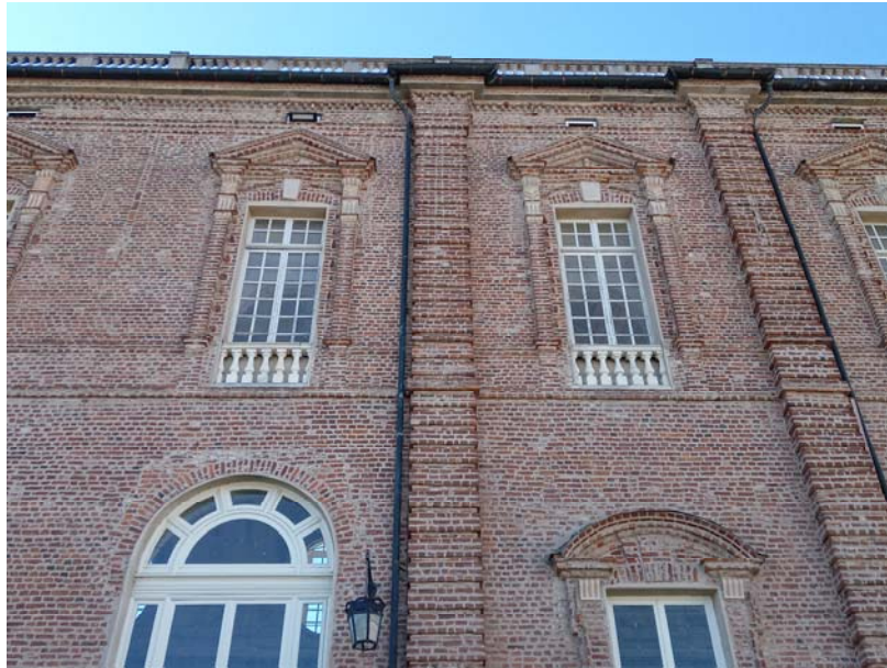
Reggia-Corte d'onore: finestre secondo livello Galleria Grande prospetto nord