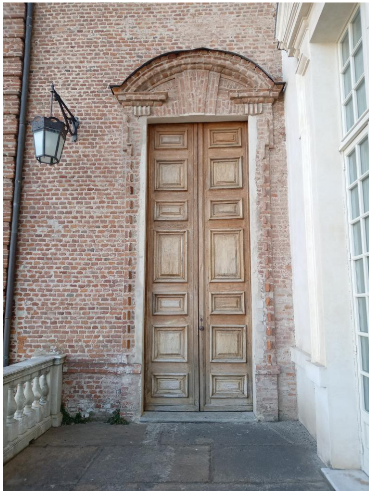
Reggia-Corte d'onore: portone di accesso alla scala del Piacenza