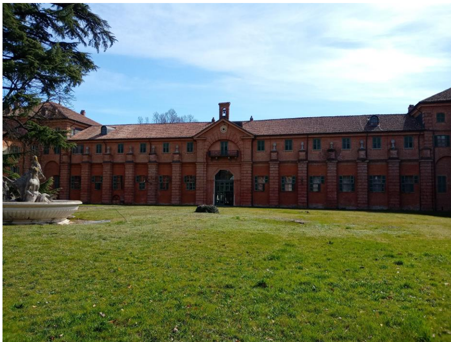
Borgo Castello: prospetto nord interno cortile