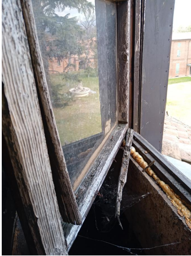
Borgo Castello: finestre abbaini