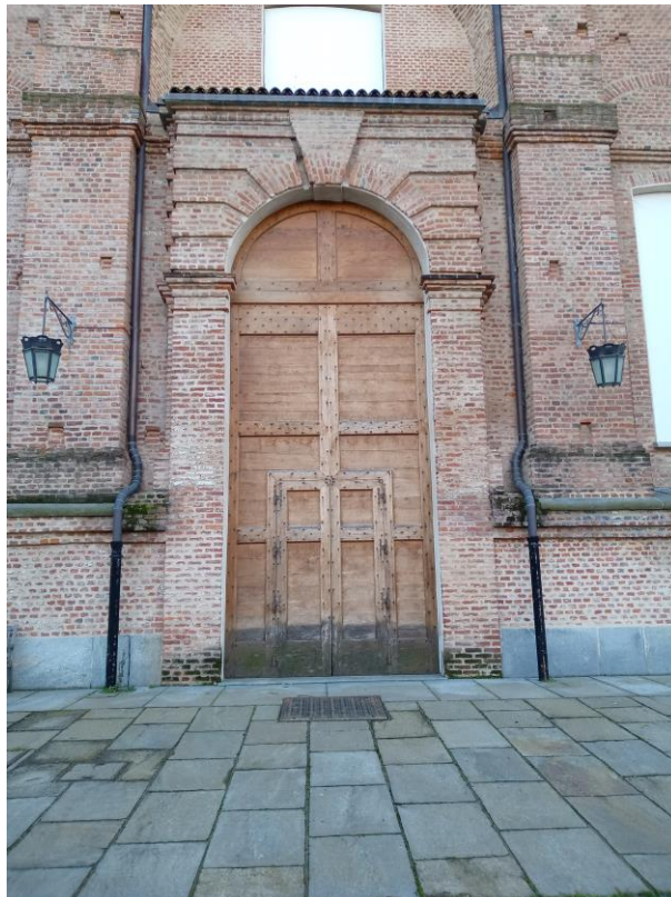
Citroniera-Scuderia: prospetto nord portone scuderia