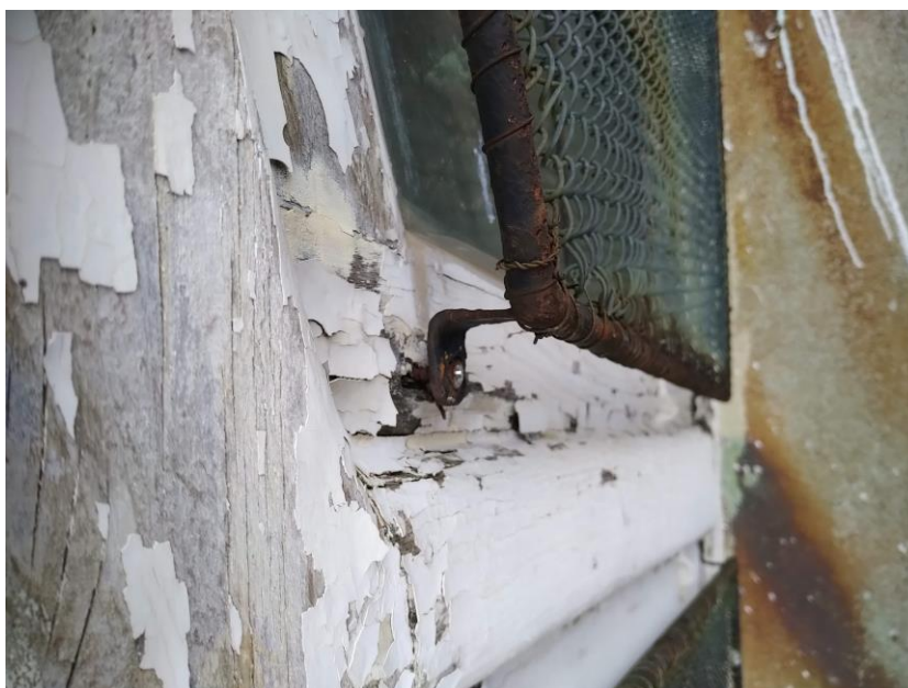
Chiesa di Sant'Uberto finestre ovali del tamburo: particolare.