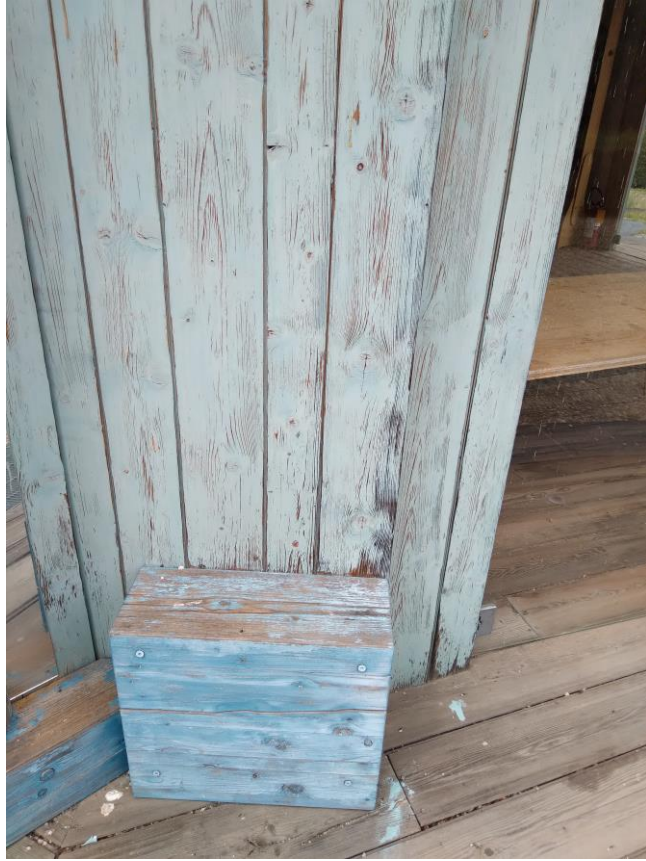
Condizione di degrado delle pareti esterne del fabbricato