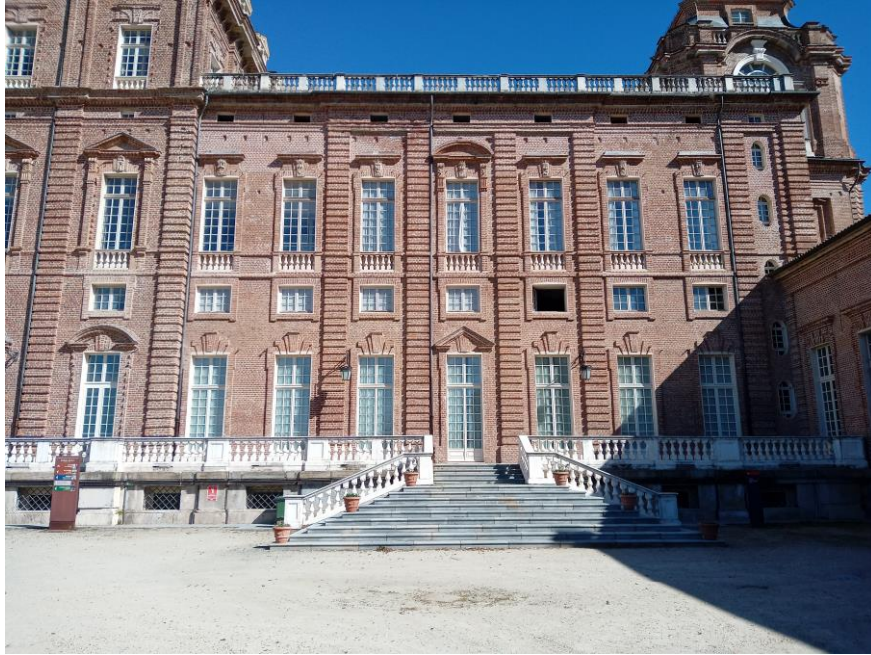
Reggia-Gran Parterre: serramenti prospetto sud