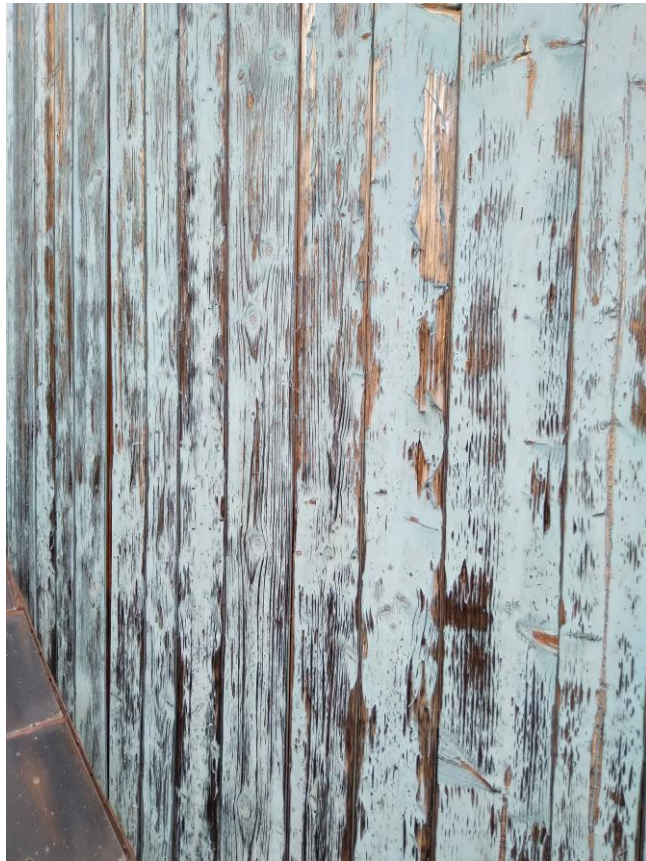
Condizione di degrado delle pareti esterne del fabbricato