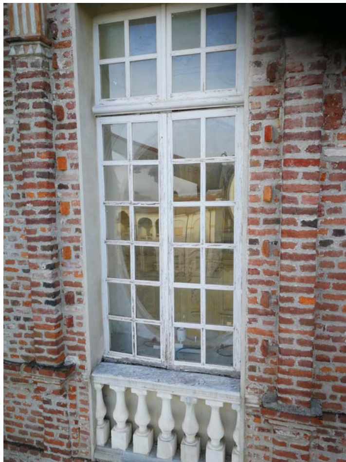
Reggia-Corte d'onore: finestre secondo livello Galleria Grande prospetto nord