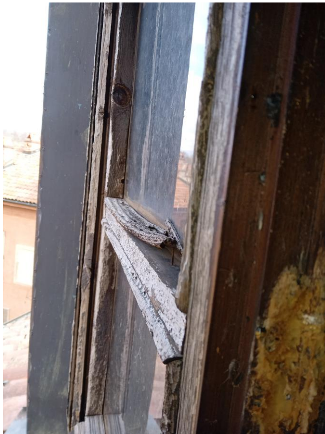
Borgo Castello: finestre abbaini