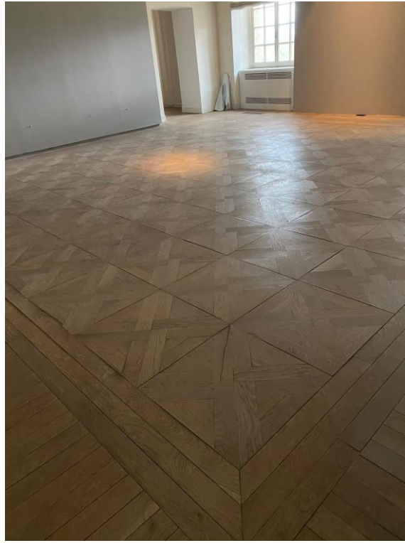
Sale delle Arti: pavimenti in legno