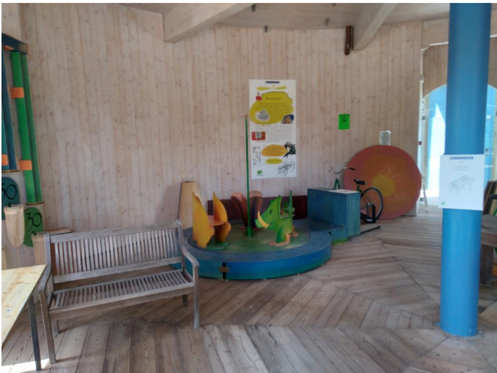
Allestimento interno del piano terreno