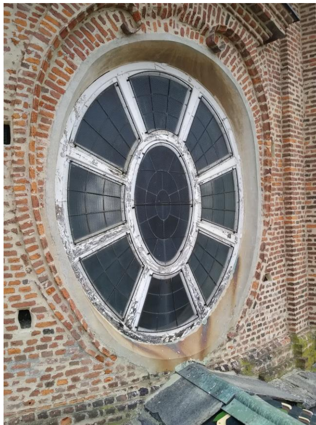
Chiesa di Sant'Uberto finestre ovali del tamburo