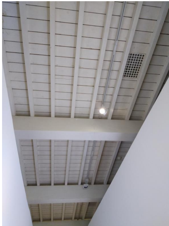
Sale delle Arti: soffitto in legno