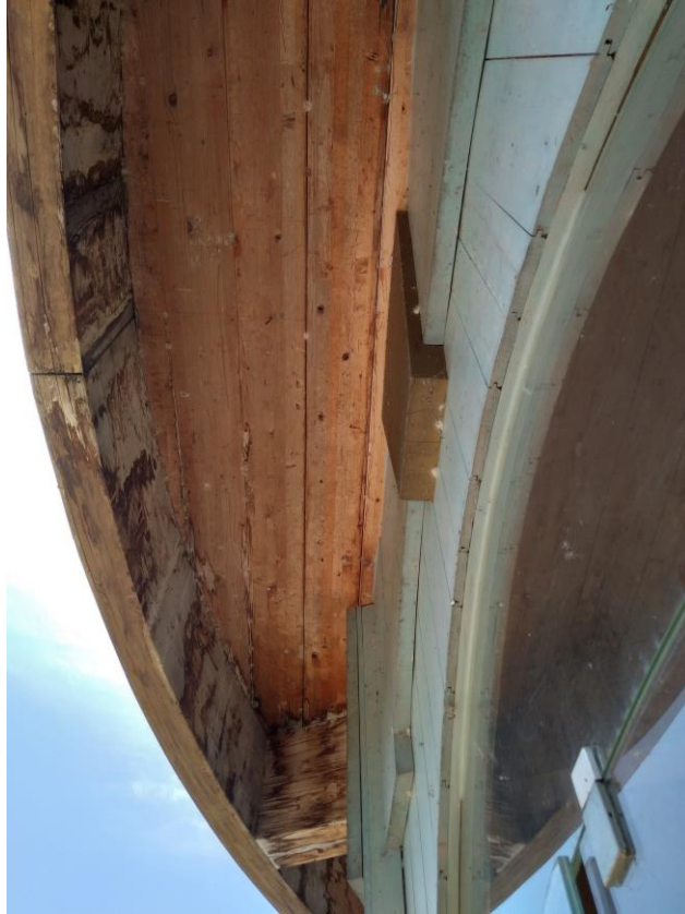
Intradosso della terrazza del primo piano