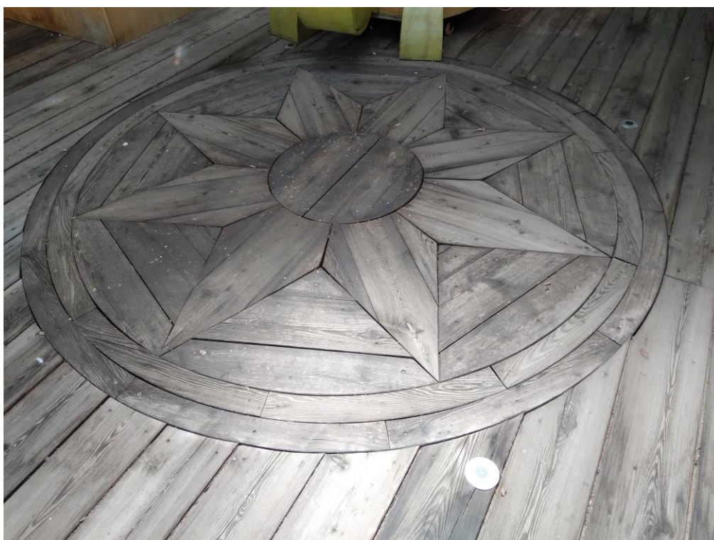
Pavimentazione interna del primo piano