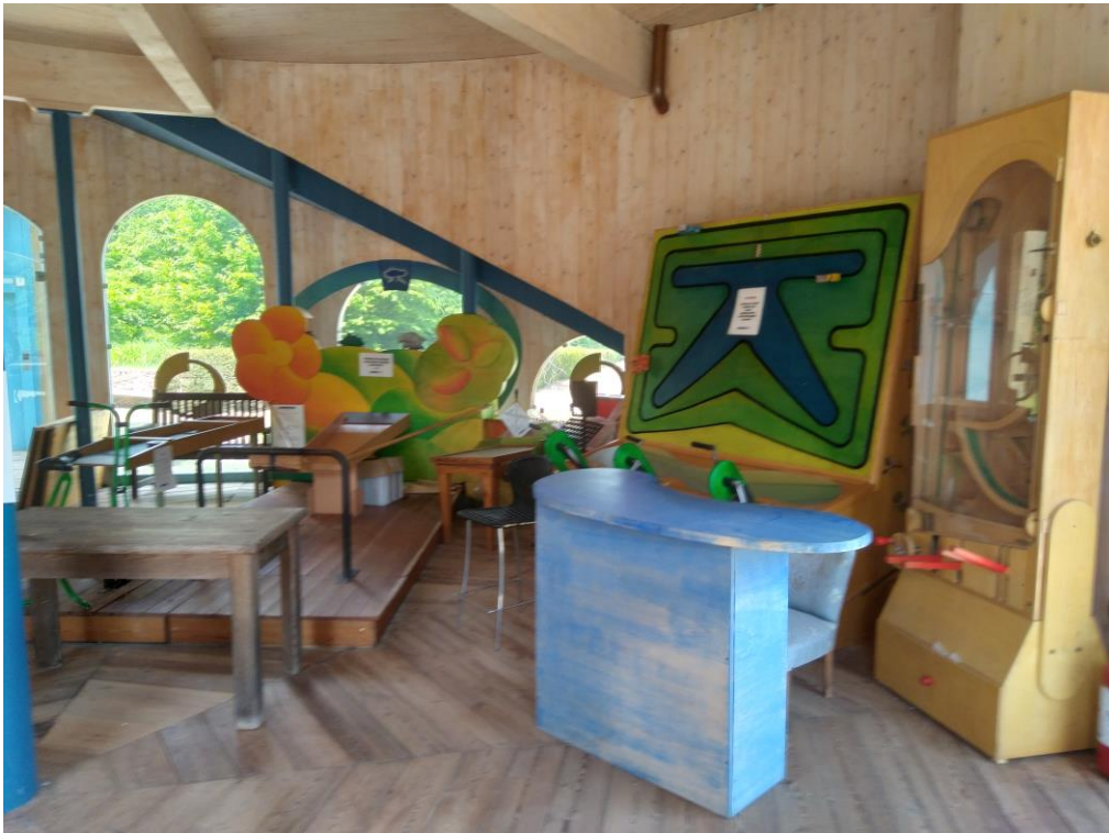
Allestimento interno del piano terreno