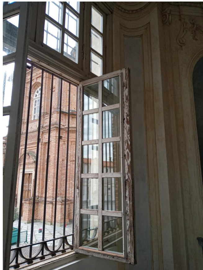
Reggia- Belvedere Alfieriano: serramento del piano nobile lato est