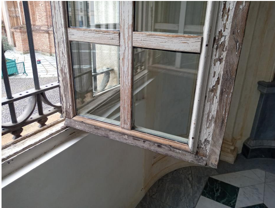
Reggia-Belvedere Alfieriano: serramento del piano nobile lato est-particolare-