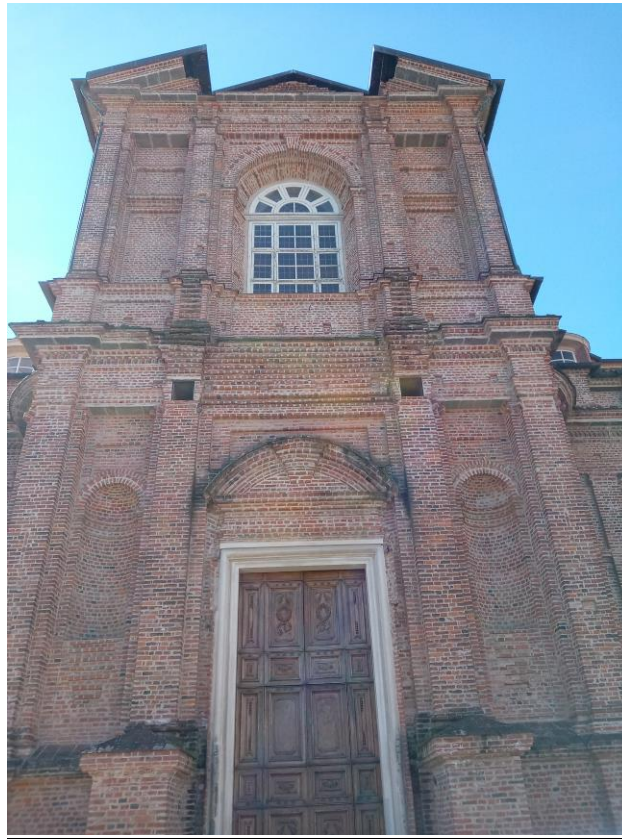
Chiesa di Sant'Uberto prospetto nord: finestrone sopra l'ingresso principale