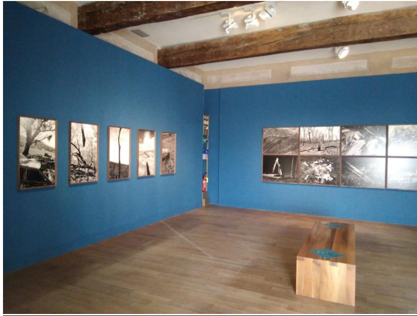
Sale delle Arti: pareti in MDF