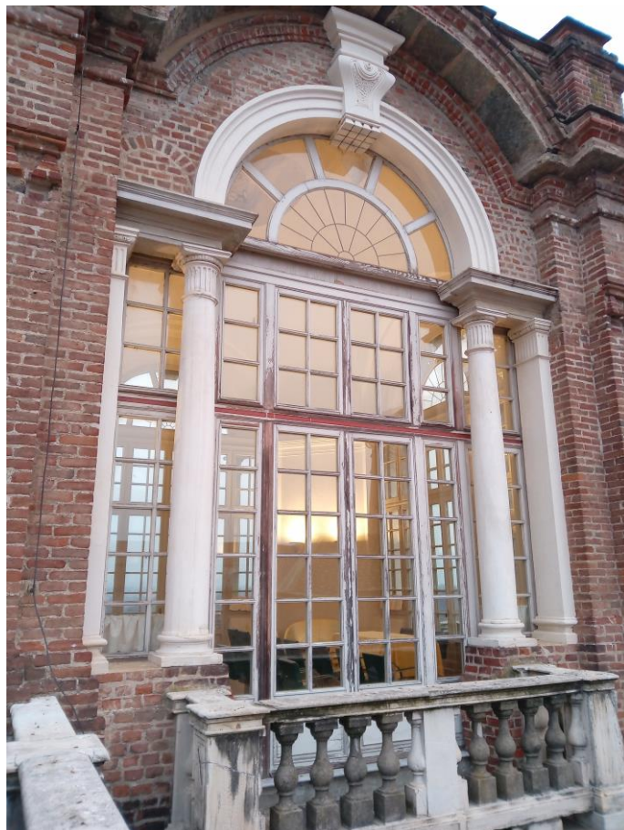
Reggia-Belvedere Alfieriano: serramento lato sud