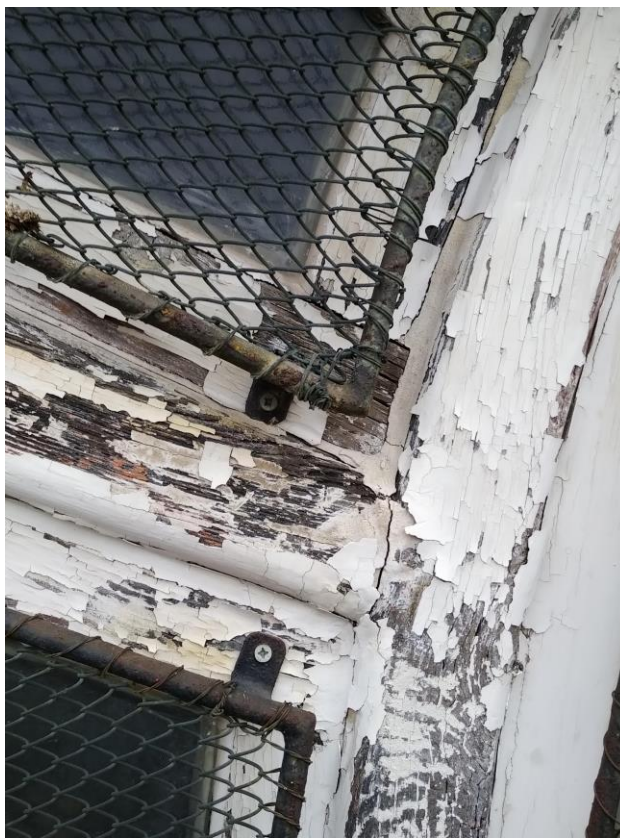
Chiesa di Sant'Uberto finestre ovali del tamburo: particolare.