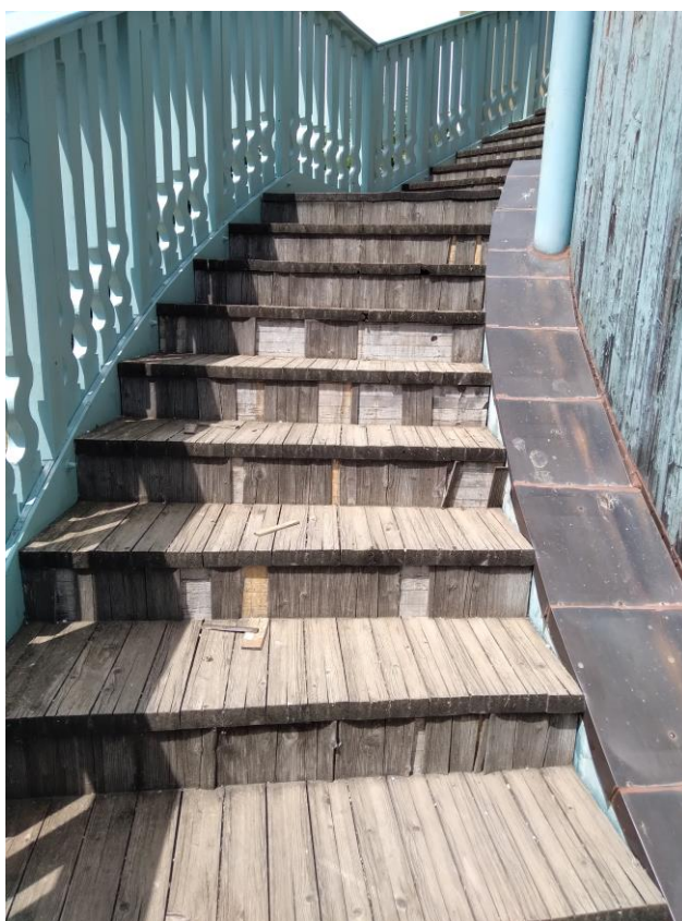
Condizione di degrado della scala di accesso al primo piano