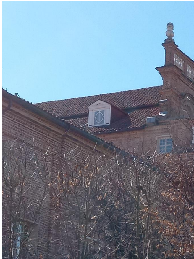
Citroniera-Scuderia: prospetto nord abbaino con parti di decoro ligneo marcite