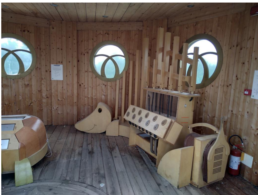
Allestimento interno del piano primo