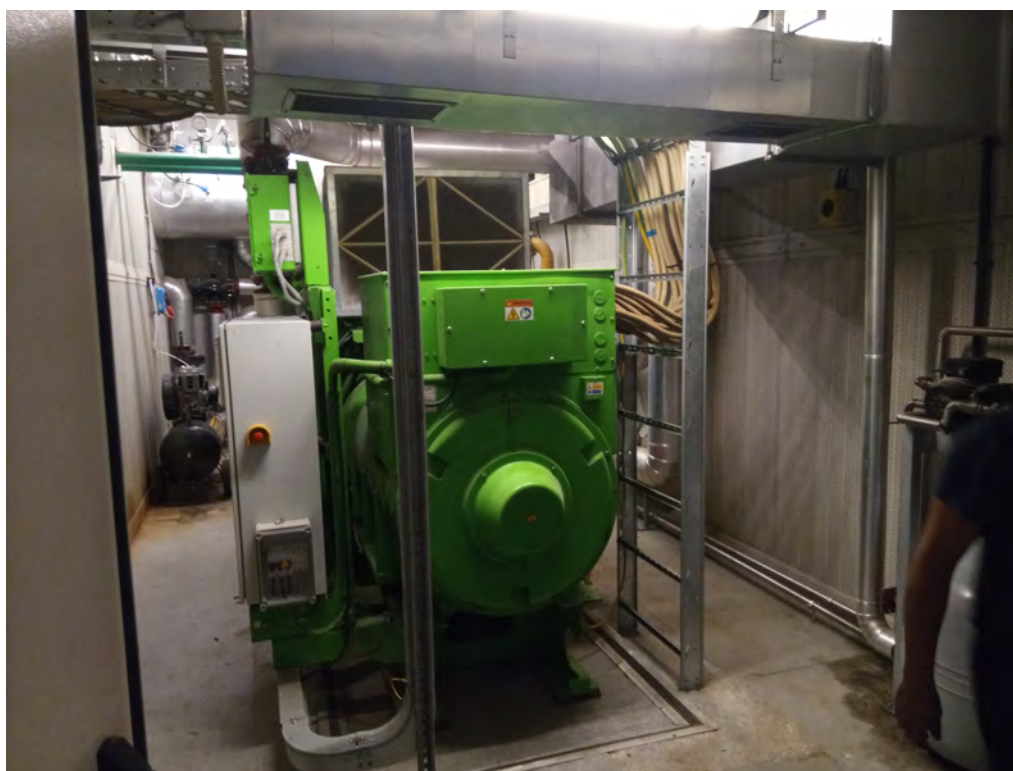
6. Locale in cui è ubicato il cogeneratore