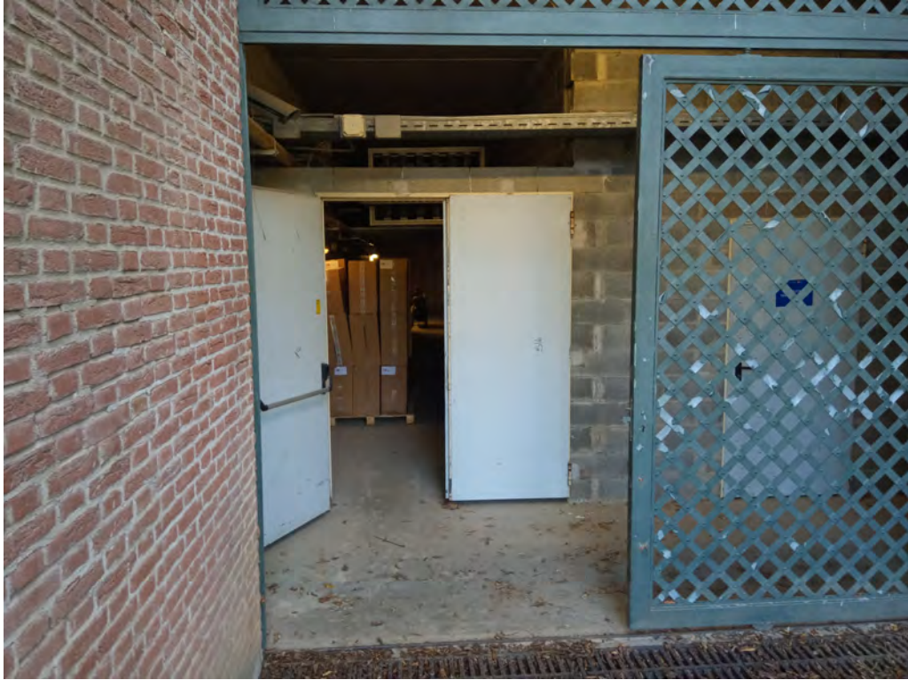
3. Accesso alle Grandi Centrali (locali tecnologici in cui è installato il cogeneratore)