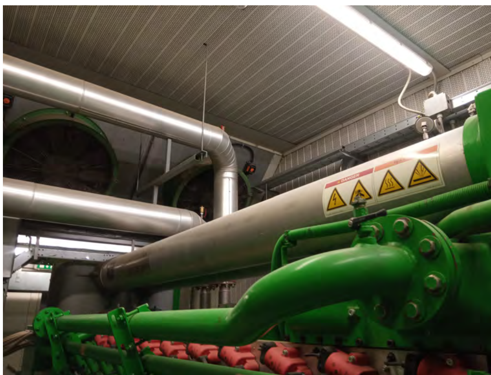
8. Locale in cui è ubicato il cogeneratore