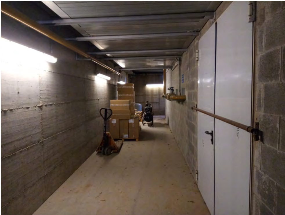
4. Corridoio di collegamento tra accesso esterno e locale in cui è ubicato il cogeneratore