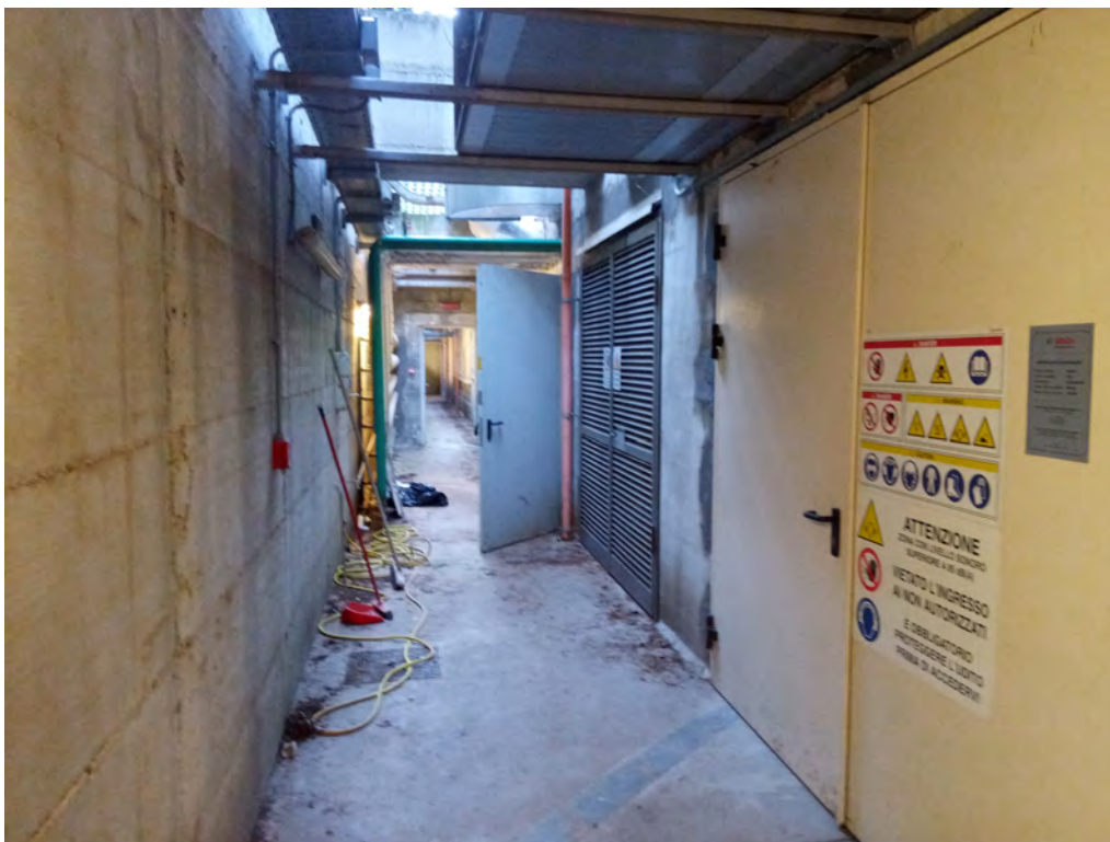
5. Corridoio di servizio, con griglie di areazioni superiori e porta di accesso al locale in cui è ubicato il cogeneratore