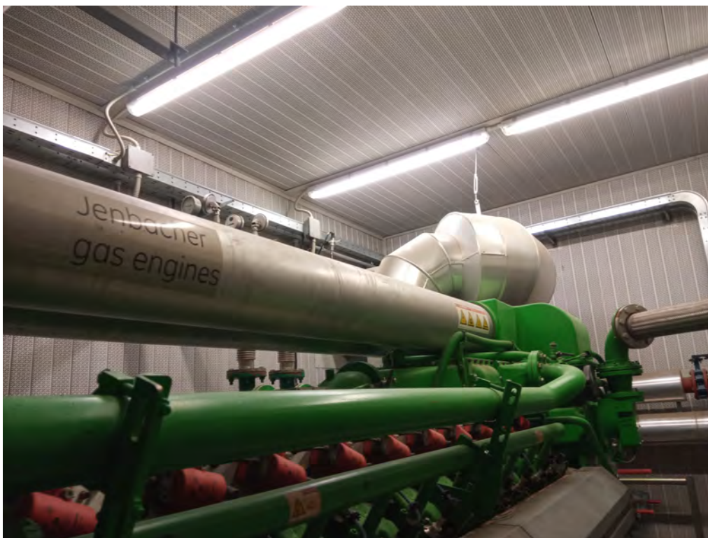
7. Locale in cui è ubicato il cogeneratore