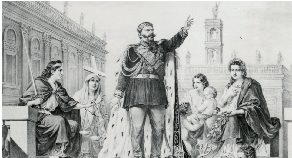
G.G. Bini - A. Masutti, Le virtù e le arti celebrano Vittorio Emanuele II in Campidoglio, 1870-75 ca.