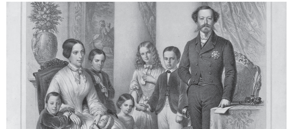
Anonimo, La famiglia reale di Sardegna, Torino, Fratelli Doyen 1853