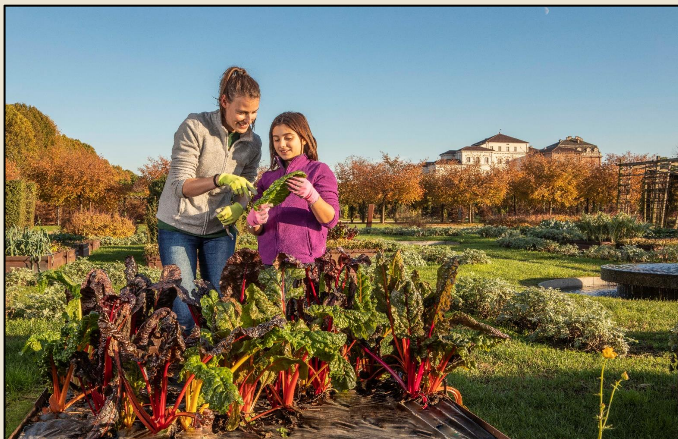
Il Potager Royal nei Giardini della Reggia

Per maggiori informazioni: www.lavenaria.it