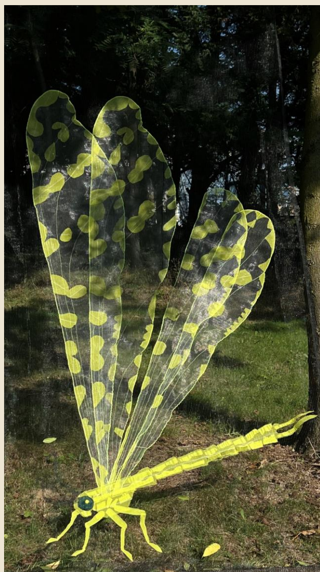
Libellula di Hilario Isola

Ufficio Stampa Consorzio delle Residenze Reali Sabaude