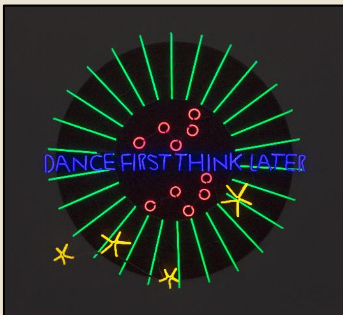
MARINELLA SENATORE, Dance First Think Later , 2021. Tubi di vetro con miscela di gas priva di mercurio (greeNeon) montati su struttura in acciaio verniciato. 120 x 120 x 15 cm.

Nella pratica della Senatore il tema della luce è componente fondamentale: si tratta infatti di uno dei linguaggi privilegiati dall'artista sin dai suoi studi in discipline cinematografiche presso il Centro Sperimentale di Cinematografia di Roma. La luce, elettrica e ottica, materiale e metaforica, diventa mezzo di narrazione e creazione poetica, così come di resistenza e coesione . Come spiega l'artista, « le sculture di luce sono generatori di energia che, sotto forma di fasci luminosi, si propaga attraverso lo spazio, cambiandolo e modificandone le strutture così come gli individui presenti in esso ». Le opere rimandano alle forme dell'architettura barocca, ma invitano alla contemplazione e all'azione con citazioni sul senso identitario del singolo e della collettività , come la più nota "Dance First Think Later", tratta da Samuel Beckett, o "We Rise by Lifting Others", tracciate con neon mercury-free, che riprendono il disegno e la calligrafia dell'artista.