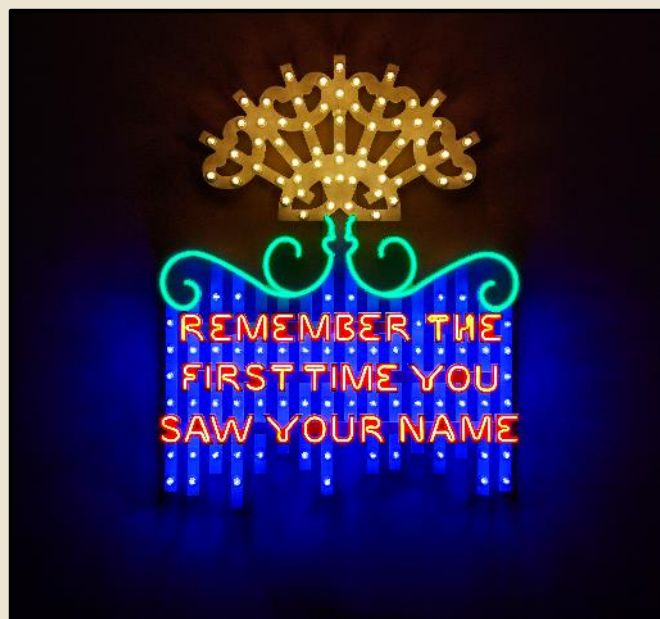
MARINELLA SENATORE, Remember The First Time You Saw Your Name , 2022. Lampadine LED e Flex LED su struttura in legno. 120 x 96.4 cm. Photo credits: Renato Ghiazza. Courtesy: L'artista e Mazzoleni London - Torino

Tutte le opere di Marinella Senatore presenti a Venaria sono state concepite per garantire consumi energetici ridotti e sostenibili . Sono state inoltre realizzate ricorrendo alla luce LED e al neon mercury-free , un'innovativa tecnologia che permette di produrre lampade prive di mercurio, metallo altamente inquinante e già bandito in diversi paesi europei, assicurandone la durata.