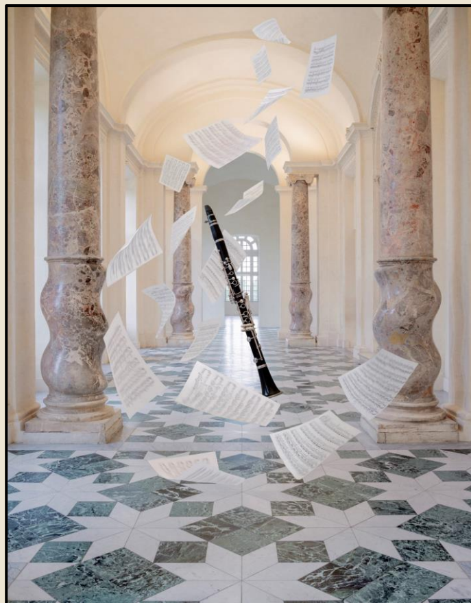
Reggia di Venaria: Galleria Grande e Galleria Alfieriana