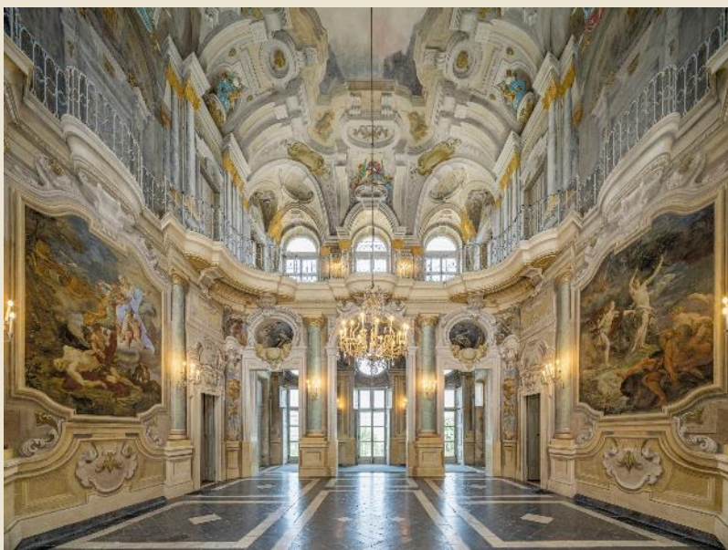
Villa della Regina (Torino)