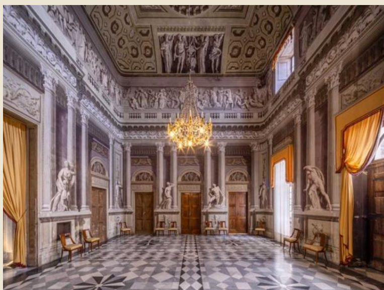
Castello di Govone