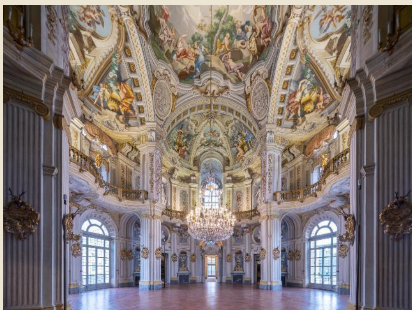
Palazzina di Caccia di Stupinigi (Nichelino)