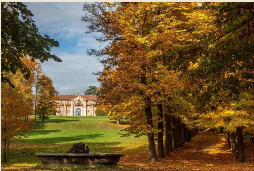
Castello della Mandria (Venaria)