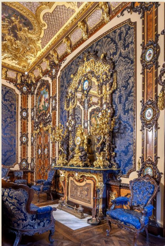
Castello di Moncalieri