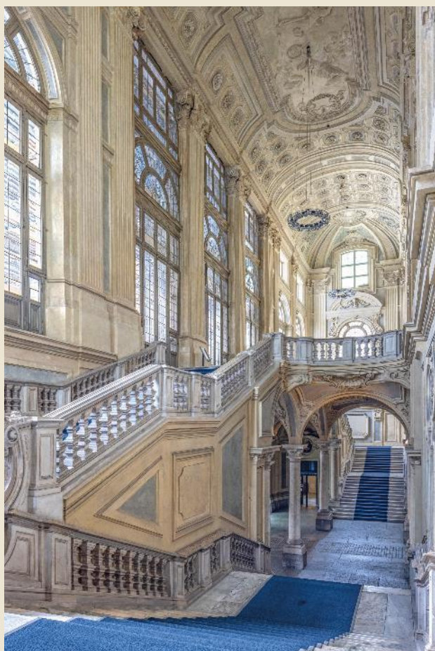
Palazzo Madama (Torino)