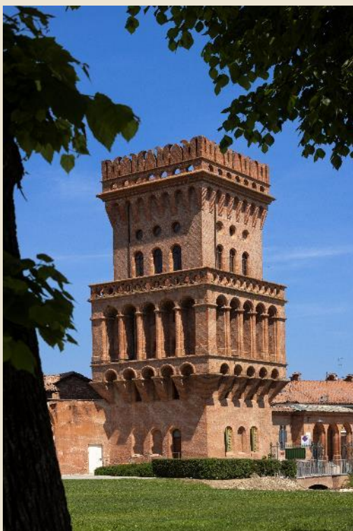
Tenuta di Pollenzo (Bra)