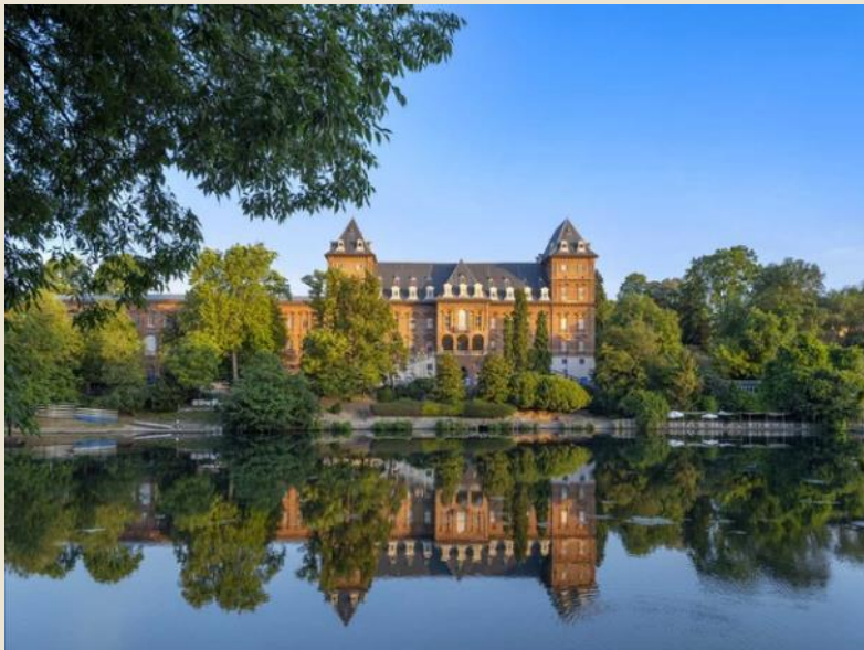
Castello del Valentino (Torino)