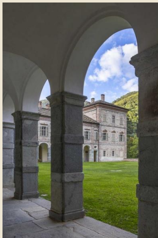
Castello di Valcasotto