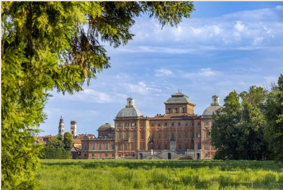
Castello di Racconigi