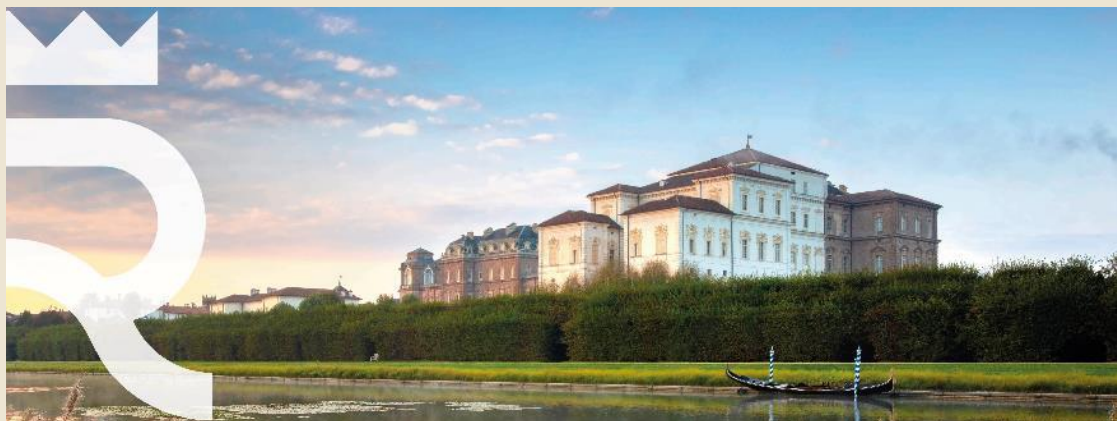
Reggia di Venaria