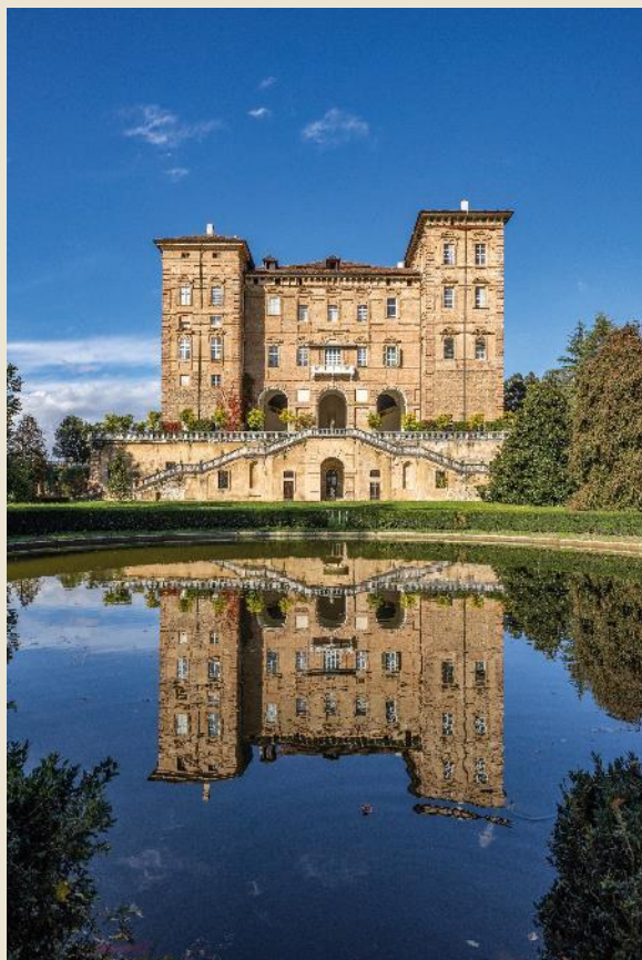
Castello di Agliè