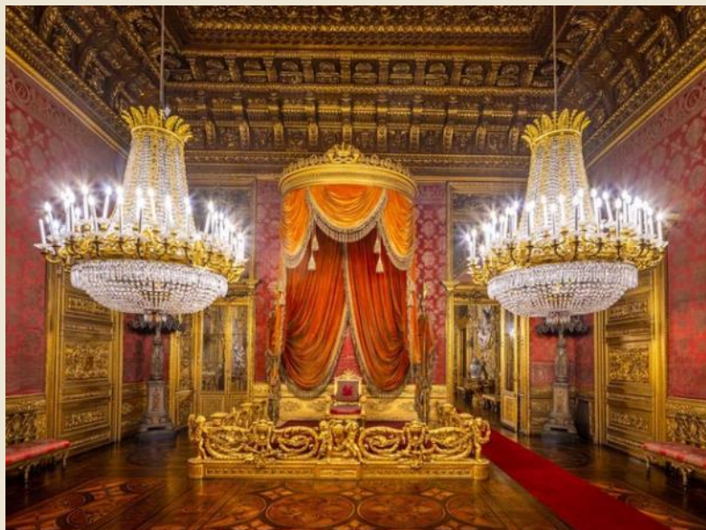
Musei Reali – Palazzo Reale (Torino)