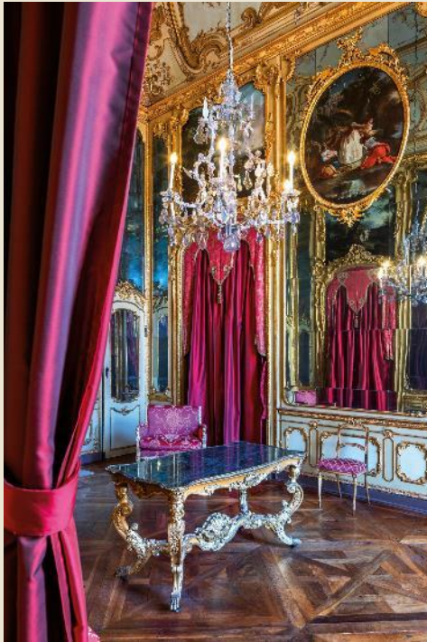
Palazzo Chiabrese (Torino)