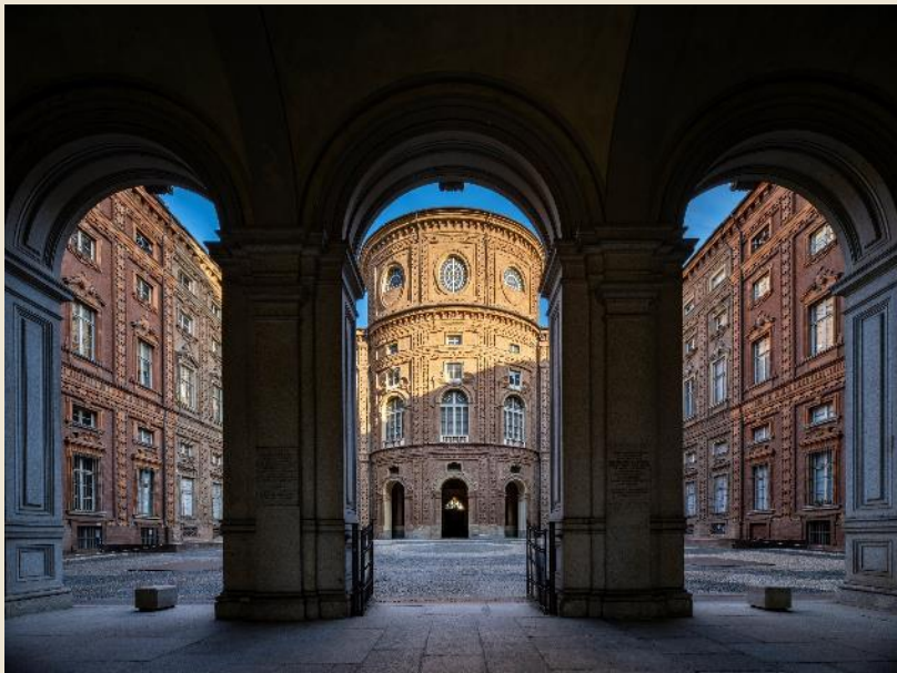
Palazzo Carignano (Torino)