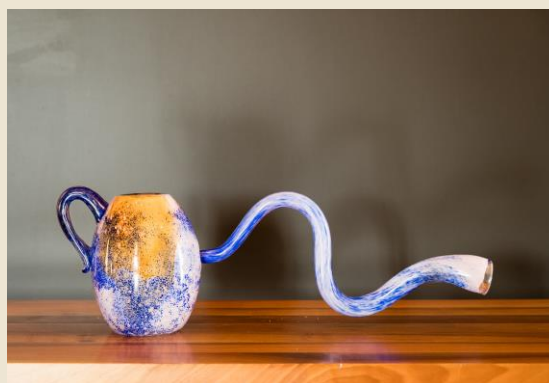
Laure Prouvost (Croix-Lille, 1978) Forward Looking Teapot By Grandma , 2017 vetro