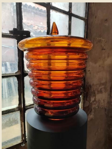
Thomas Schütte (Oldenburg, 1954) Untitled , 2024 vetro