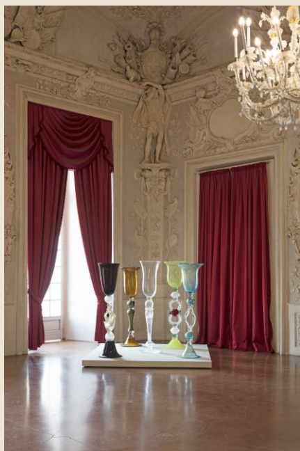
Vik Muniz (San Paolo, 1961) Individuals , 2017 vetro Courtesy Berengo Studio