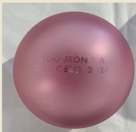
Koo Jeong A (Seul, 1967) KOO JEONG A OCV 2024 , 2024 vetro