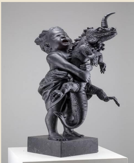
Koen Vanmechelen (Sint-Truiden, 1965) Cosmopolitan Fossil I , 2021 marmo nero di Carrara e vetro