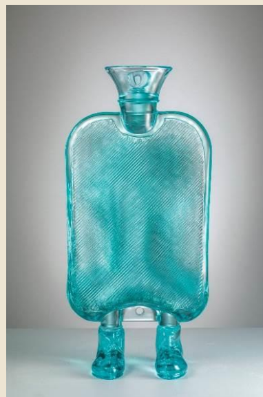
Erwin Wurm (Bruck an der Mur, 1954) Mutter , 2023 vetro