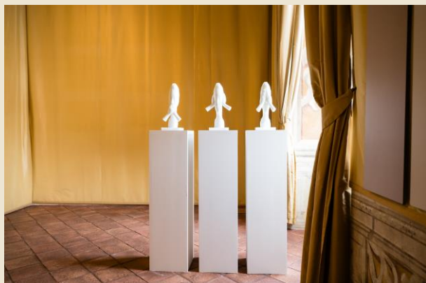
Jaume Plensa (Barcelona, 1955) See No Evil, Hear No Evil, Speak No Evil , 2018 vetro