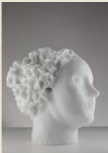
Vanessa Beecroft (Genova, 1969) Angel , 2022 vetro