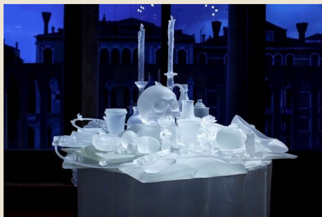
Hans Op de Beeck (Turnhout, 1969) The Frozen Vanitas , 2015 vetro