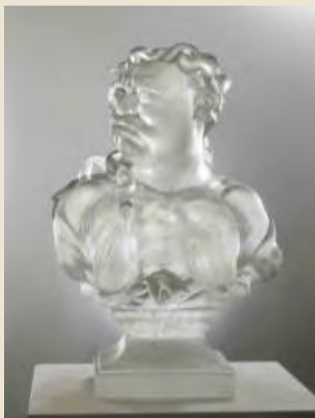
Ai Weiwei (Pechino, 1957) Artist As Invidia , 2022 vetro

Diverse opere dell'artista e attivista cinese Ai Weiwei traggono ispirazione da fonti storiche e le reinterpretano in chiave contemporanea, mentre un tema simile ritorna nelle opere ibride di Koen Vanmechelen che utilizza statue di marmo come base per esplorazioni nel vetro. Un tocco surreale è presente nella poetica tenda che rimanda a William Blake dello spagnolo Jaume Plensa , nella teiera con il beccuccio esteso come un naso curioso della francese Laure Prouvost e nei giganteschi bicchieri di Murano del brasiliano Vik Muniz , mentre dalla borsa dell'acqua calda dell'austriaco Erwin Wurm spuntano un paio di scarpe, pronte a fare un passo verso l'ignoto.