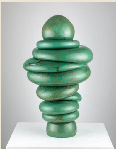
Tony Cragg (Liverpool, 1949) Spine Green , 2021 vetro