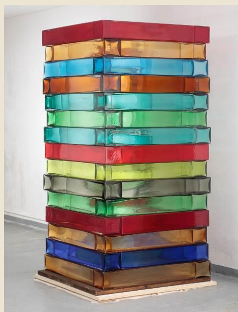
Sean Scully (Dublino, 1945) Venice Stack , 2019 vetro