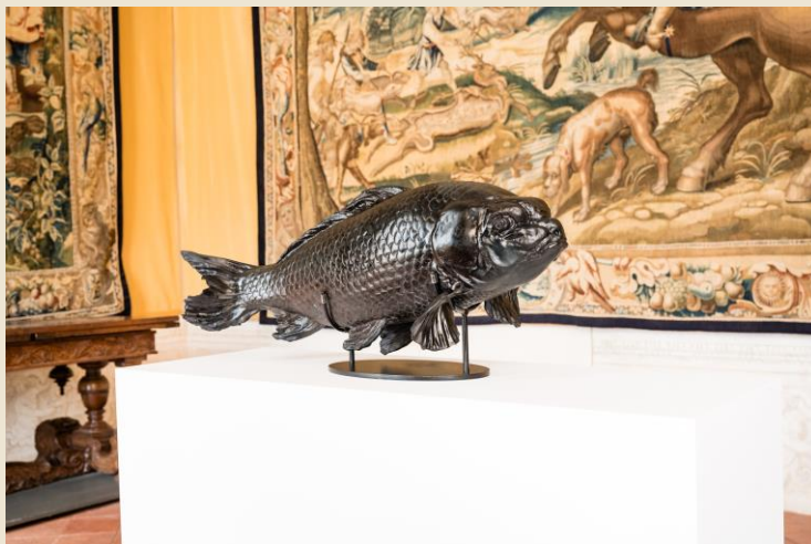
Ai Weiwei (Pechino, 1957) Untitled (Fish), 2022 Vetro