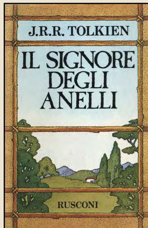
Il Signore degli Anelli, 1977 Illustrazione Piero Crida

L'AUTORE – una sezione più ampia che racconta il narratore e le sue due più importanti opere: Lo Hobbit e Il Signore degli Anelli . Sono inoltre presenti alcune