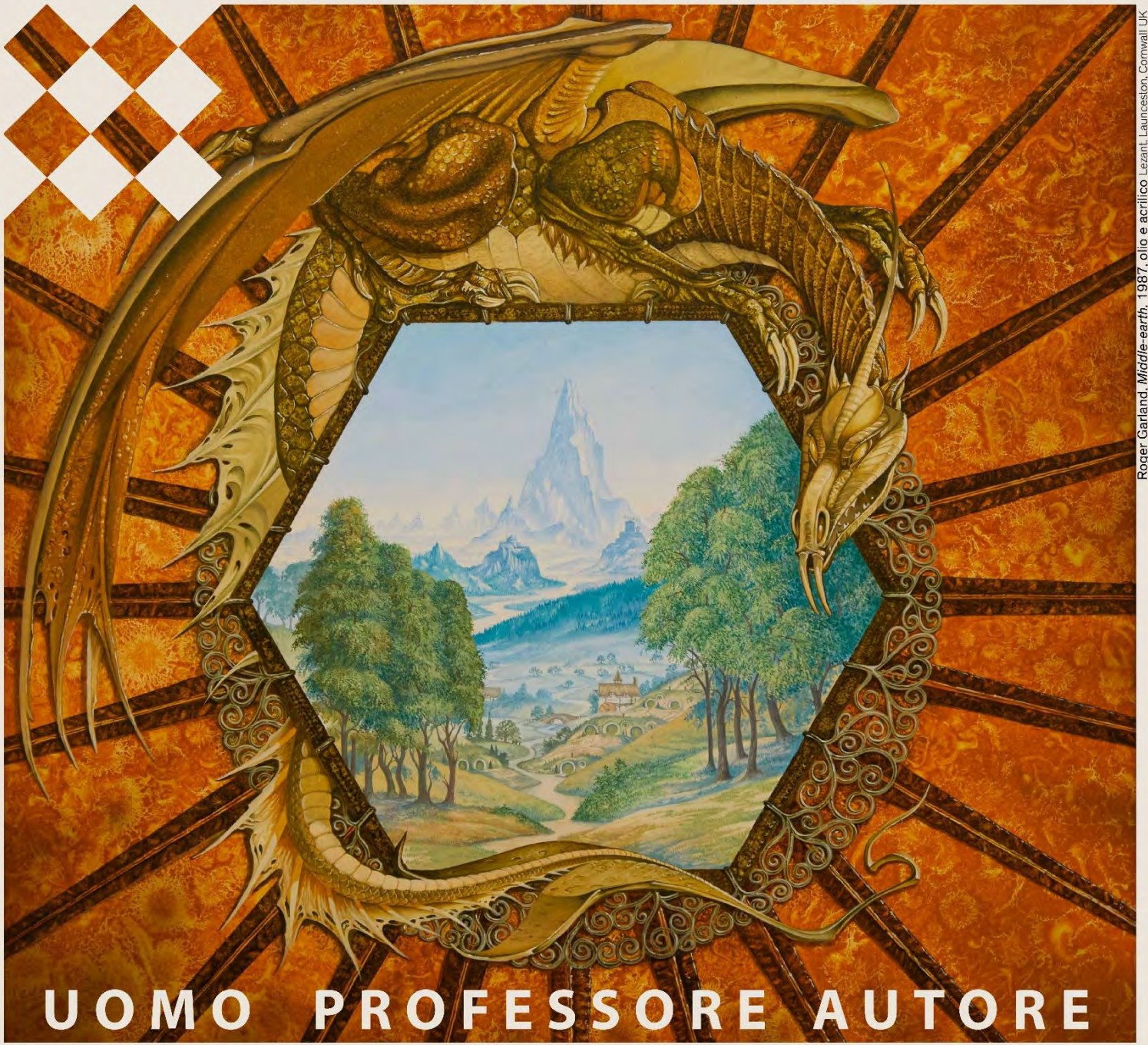
Roger Garland, 'Middle-earth', 1987, olio e acrilico. Lezant, Launceston, Cornwall, UK